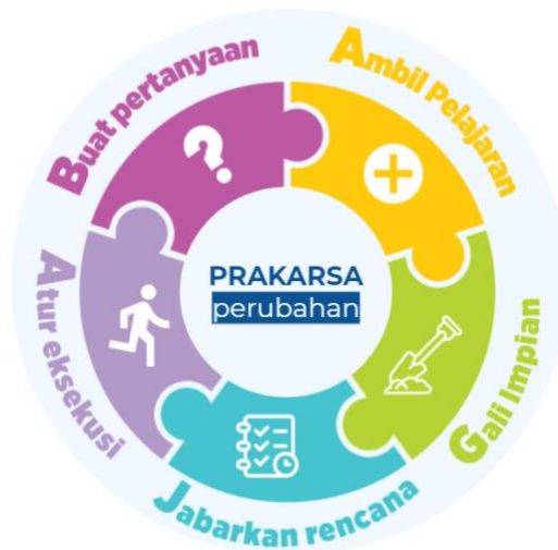
Gambar 2. Tahapan BAGJA

Jabarkan Rencana, Atur Eksekusi). Silakan simak dan pelajari videonya terlebih dahulu [ tautan video 1 BAGJA Pusdatin ciri dan deskripsi akronim BAGJA].