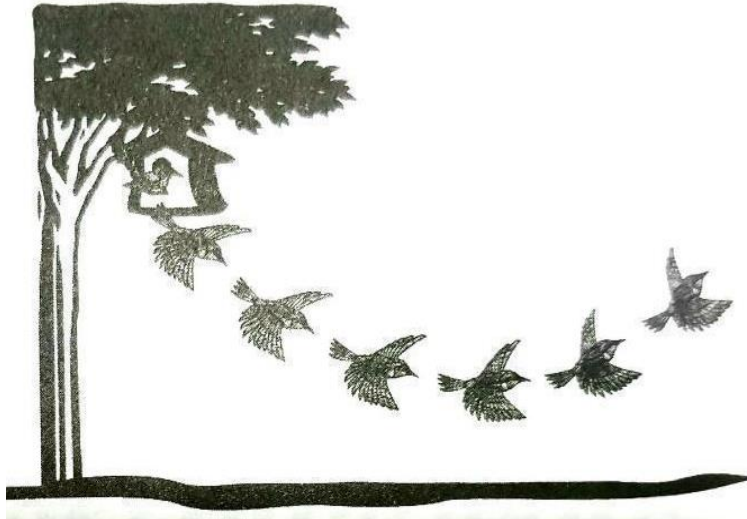
Gambar 4. Kurva belajar [sumber: "Business School" Kiyosaki & Letcher, 2001]

Kurva belajar yang Bapak/Ibu akan alami mirip seperti seekor anak burung yang belajar terbang (Gambar 4). Pada saat pertama kali terbang, jalur terbang anak burung tidak akan langsung ke atas, tapi akan ke bawah dahulu kemudian meliuk ke atas sebagaimana terlihat pada gambar berikut.